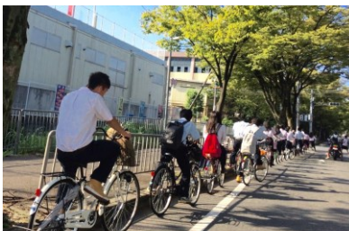
大阪府立吹田東高等学校

講師紹介 ：大阪市自転車通行環境整備に関する検討会議委員をはじめ、自治体の自転車関連委員を務める。また、市民、学生、子供など、年齢層に応じた自転車交通安全教育プログラムの開発と講師を務め、警察との連携による自転車交通安全教室も継続して行っている。今年で第11回となる大阪での御堂筋サイクルピクニックを主催、多くのボランティアと共に大阪の自転車安全啓発イベントとして定着させた。